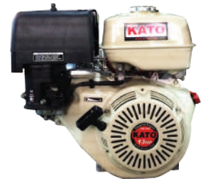
SG series Air Cooled 4-Cycle Gasoline