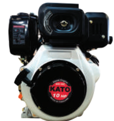
SM series Air Cooled 4-Cycle Diesel