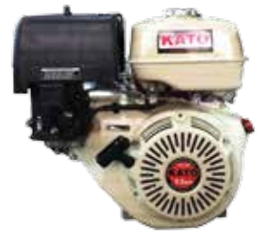
Air Cooled 4-Cycle Gasoline