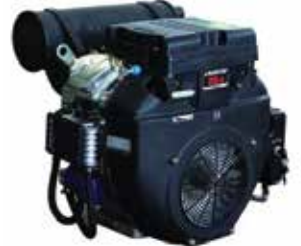
Air Cooled 4-Cycle Gasoline