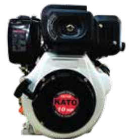
Air Cooled 4-Cycle Diesel